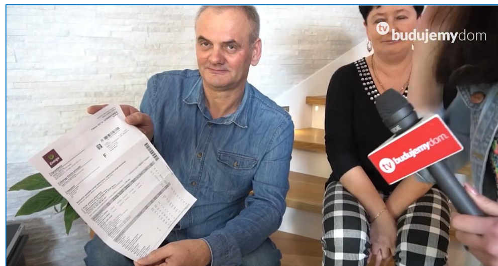
Konkurs dla instalatorów „Dom Bez Rachunków”

Każdy segment ma powierzchnię około 95 metrów kwadratowych, a w całym domu zainstalowane jest ogrzewanie podłogowe. Rachunki mieszkańców za ogrzewanie oraz energię elektryczną to niemal zero złotych. Co dwa miesiące płacą jedynie rachunek ok 30 złotych (czyli równy kosztowi opłat stałych za prąd).